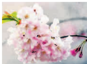
Auch Kassins' Frühe tragen im Mai Kirschlilien in Zartrosa

• 29 800 Tonnen Äpfel wurden 2009 in Brandenburg geerntet, auf einer Anbaufläche von 1200 Hektar. Im Vergleich zum Vorjahr waren es auf der gleichen Fläche 6800 Tonnen weniger. Hauptanbaugelände befinden sich in Potsdam-Mittelmark, Märkisch Oderland und Frankfurt (Oder).