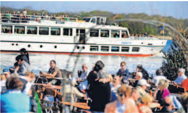
Weiße Flotte, buntes Volk: Im Garten des Fischrestaurants „Arielle“ in Werder können die Gäste direkt am Wasser sitzen und auf die Fährschiffe blicken