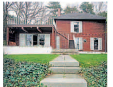
Fluchtpunkt und Denk-Ort: Albert Einsteins Sommerhaus in Caputh

Während Schloss und Park in Caputh nach dem Ende der DDR aufwendig restauriert wurden, liegt beides in Petzow noch immer im Dornröschenschlaf. Demnächst soll das von Karl-Friedrich Schin-