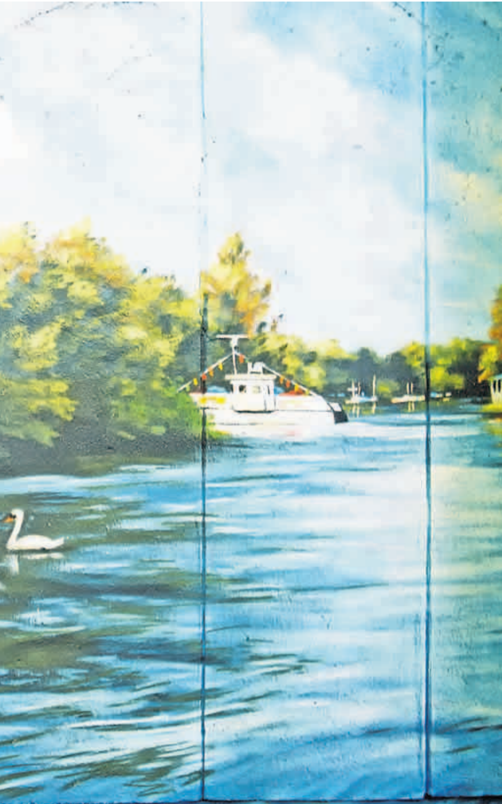
auf Wunsch der Anwohner mit dem Schiwlensee und seiner Fähre bemalt wurde