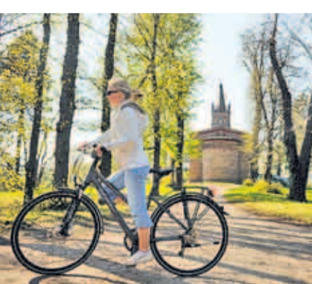
Durch lichte Wälder und vorbei an historischen Bauten führt die Caputher Fünf-Seen-Radtour