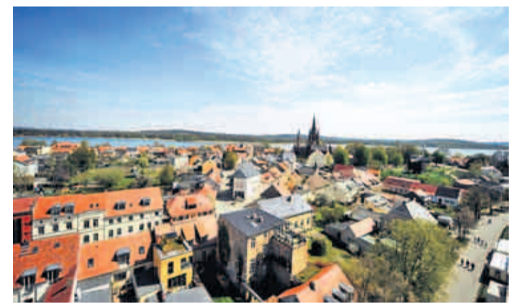
Der Turm der Heilig-Geist-Kirche wacht über die schmalen Gassen und bunten Häuschen in der Inselstadt von Werder. Der älteste Stadtteil wird von der Havel umspült