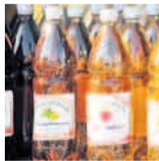
Im Obstbaumuseum erfährt man auch, wie der Werdersche Obstwein entsteht

Einen Kilometer südlich liegt das Ziegeleimuseum Glindow. Als Berlin mit Beginn des Industriezeitalters rasant wuchs, baute man mit Ziegeln aus Werder. In der Ziegelei können Besucher erleben, wie Ziegel im historischen Handstichverfahren hergestellt und im Ringofen gebrannt werden. Mit den Steinen werden heute denkmalgeschützte Bauwerke restauriert. Im alten Stadtgefängnis von Werder wird die Geschichte des Wein- und Obstbaus und der Fischerei erzählt. Abschließen kann man die Museumstour im Café Muckerstube, das wie die Wohnung einer Obstbauernfamilie eingerichtet ist.