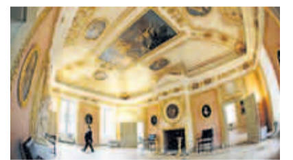
Lohnt den Weg: Das aufwendig restaurierte Schloss Caputh

Den Besuch des Fährfestes kann man gut mit einem Spaziergang entlang der idyllischen Uferpromenade oder quer durch den Ort zum Schloss Caputh (errichtet ab 1662) verbinden, dem einzig erhaltenen Lustschloss des Großen Kurfürsten Friedrich Wilhelm von Brandenburg. Porzellan-Liebhaber werden besonders die 7500 holländischen Fayencen im Fliesensaal begeistern. Vor dem Schloss lädt der Garten des Café Barock zum Verweilen ein. Wem der